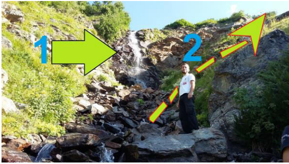
ისარი 1-ით ნაჩვენებია ჩანჩქერი. ისარი 2-ით კი მონიშნულია მიმართულება, თუ როგორ ვუვლით გვერდს ჩანჩქერს და ავდივართ დიდი აღმართის მეორე მონაკვეთზე.

ნაკადულზე არსებულ ჩანჩქერს მივადგებით. გასათვალისწინებელია, რომ ჩანჩქერი ხანდახან დამშრალია, თუმცა ამ ადგილის იდენტიფიცირება ადვილია, რადგან ჩვენ წინ ციცაბო კედელია, რომელზეც საცოცი აღჭურვილობის გარეშე ვერ ავალთ.