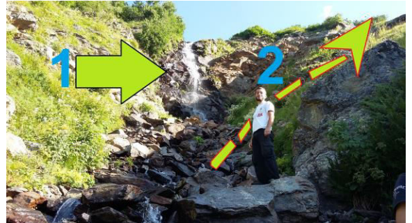
The waterfall is marked by the arrow 1. Arrow 2 shows the direction how we pass the waterfall and climb on the second section of the Big Ascent.

waterfall made by the stream. Note, that the waterfall sometimes is dry. But the place is easily identifiable as there is such a steep wall in front of us that it cannot be climbed without climbing equipment.